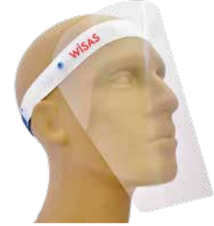
YÜZ KORUYUCU SİPERLİK