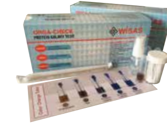
❖ PROTEİN KALINTI TESTİ