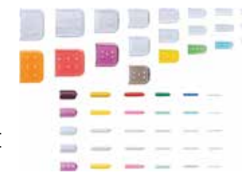
CERRAHİ ALET KORUMA UÇLARI