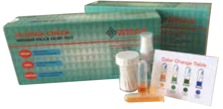
❖ İNORGANİK KİRLİLİK KALINTI TESTİ