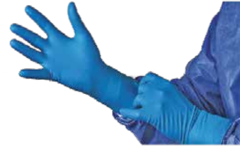
YIKAMA ELDİVENİ DİSPOZABLE