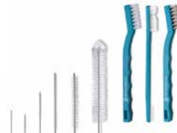
CERRAHİ ALET TEMİZLEME FIRÇASI