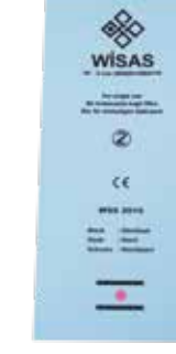
KONTEYNER FİLTRESİ DİKDÖRTGEN