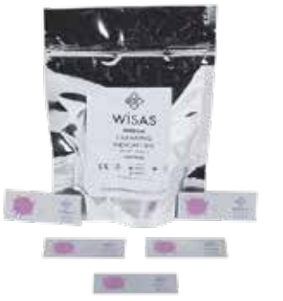
❖ YIKAMA ETKİNLİK İNDİKATÖRÜ