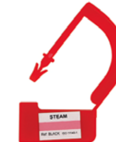
KONTEYNER KİLİDİ PLASTİK