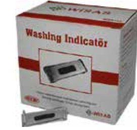
❖ YIKAMA ETKİNLİK TEST KİTİ