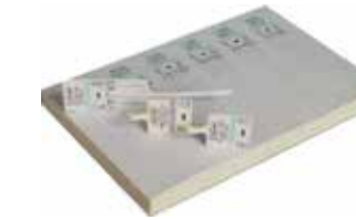
KONTEYNER MÜHÜRLEME ETİKETİ