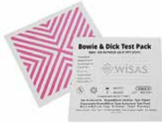
❖ BOWIE-DICK TEST KARTI