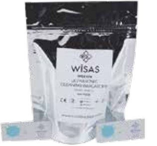
❖ ULTRASONİK ETKİNLİK İNDİKATÖRÜ