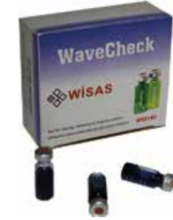
❖ ULTRASONİK ETKİNLİK TEST KİTİ