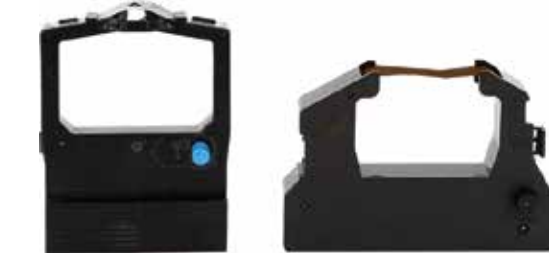
KA PATMA MAKİNESİ YAZICI KARTUŞLARI