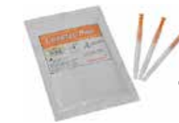
❖ HİJYEN MONİTÖRÜ PROTEİN KALINTI TESTİ (Lumisester PD-30 LuciPacPen)

AMP ve ATP ölçümü için dünya'nın en hafif ve küçük cihazı. Son derece hızlı ve hassas ölçüm.