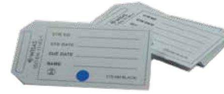
KONTEYNER ETİKETİ BÜYÜK-KÜÇÜK