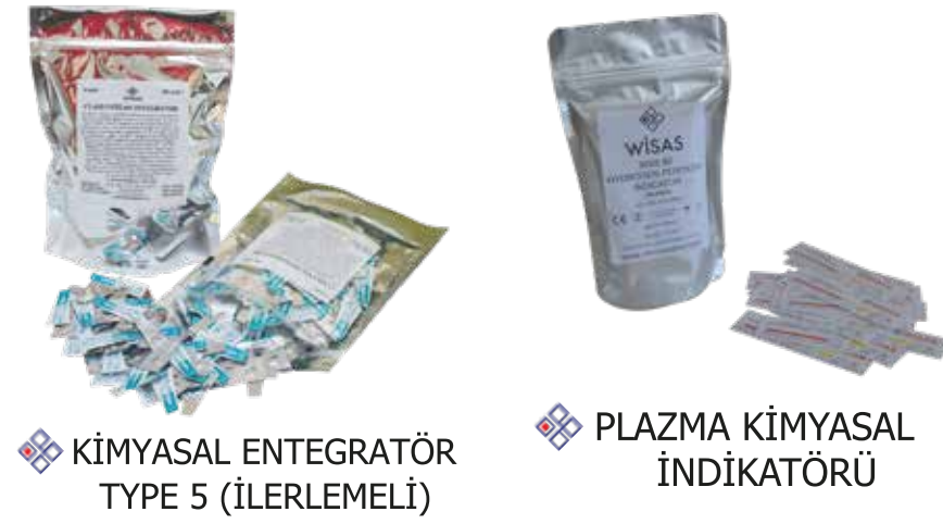
❖ KİMYASAL ENTEGRATÖR TYPE 5 (İLERLEMELİ)