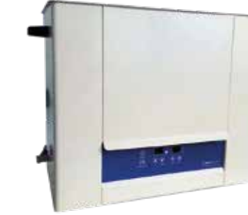
ULTRASONİK YIKAMA CİHAZLARI