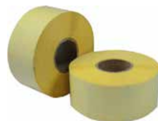
ETİLEN OKSİT DÖKÜMANTASYON ETİKETİ