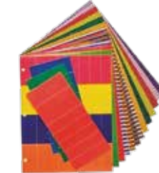
CERRAHİ ALET RENK BANTLARI