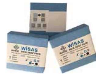
❖ BOWIE-DICK TEST PAKETİ