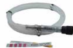
❖ BUHAR YÜK KONTROL