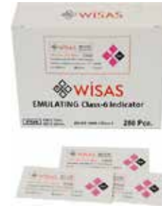
❖ BUHAR KİMYASAL İNDİKATÖR (CLASS 4-5-6)