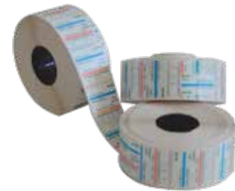
PLAZMA DÖKÜMANTASYON ETİKETİ