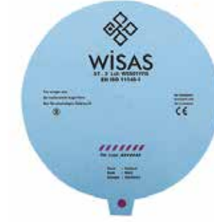
KONTEYNER FİLTRESİ YUVARLAK