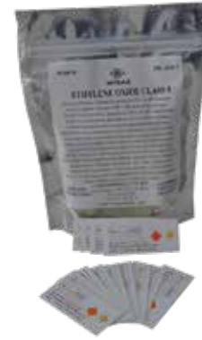
❖ ETİLEN OKSİT İNDİKATÖRÜ CLASS 5