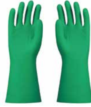
ETİLEN OKSİT ELDİVENİ