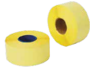
BUHAR DÖKÜMANTASYON ETİKETİ